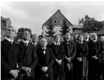
Die Bürger von Schabbach 1923, der Eindruck des letzten Krieges sitzt tief. ( Kapitel 1 )