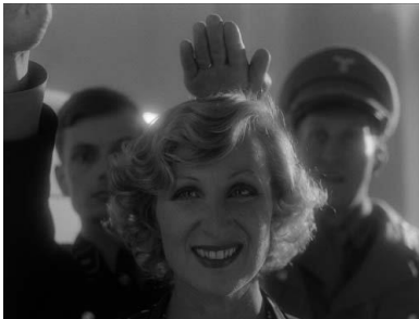
Ein Höhepunkt in Lucies (Karin Rasenack) Leben: Die Prominenz aus der Umgebung des Führers besucht sie in ihrer Villa. ( Kapitel 3 )