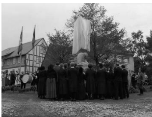
1923: Einweihung des Kriegerdenkmals in Schabbach. ( Kapitel 1 )