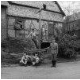
Eduard (Rüdiger Weigang) als SA-Mann. ( Kapitel 3 )