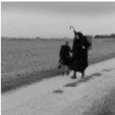
1933: Großmutter (Gertrud Bredel) kehrt mit dem Enkelkind nach Schabbach zurück. ( Kapitel 2 )