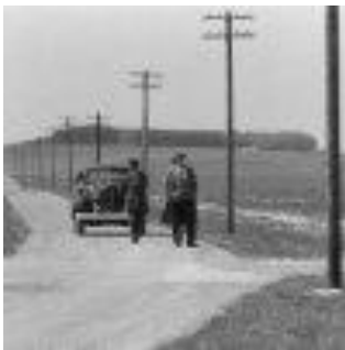
Der Amerikaner. Paul (Dieter Schaad) geht die letzten Schritte nach Schabbach zu Fuß. Der schwarze Chauffeur folgt mit dem Straßenkreutzer. ( Kapitel 5 )