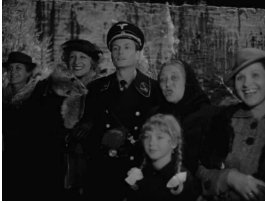
Wilfried (Hans-Jürgen Schatz) als SS-Offizier bringt sein völkisches Weihnachtsverständnis nach Schabbach. ( Kapitel 3 )