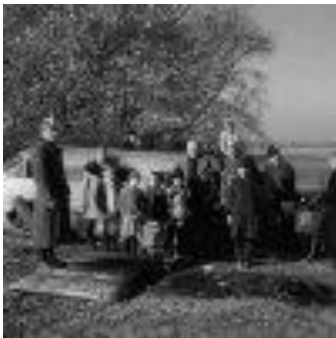
1943: Gruppenfoto der Schabbacher vor den Trümmern eines alliierten Bombers. ( Kapitel 4 )