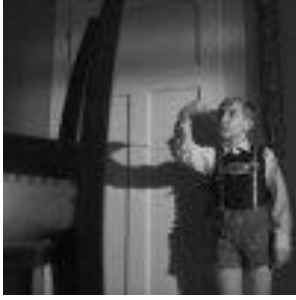
Horstchens erster Kaugummi im April 1945. ( Kapitel 5 )