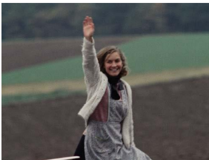
„Guten Tag, Herr Wohlleben!“. Maria (Marita Breuer) grüßt den geliebten Ingenieur von weitem. ( Kapitel 3 )