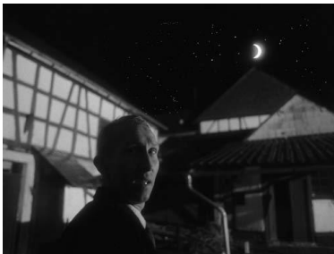
Eduard (Rüdiger Weigang) nach einem bösen Hustenanfall: Daheim ist es doch am schönsten! ( Kapitel 3 )