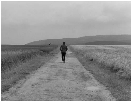
Paul (Michael Lesch) wird die Heimat für immer verlassen. ( Kapitel 1 )