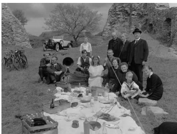
Erster Radioempfang beim Familienpicknick in der Burgruine Baldenau. ( Kapitel 1 )